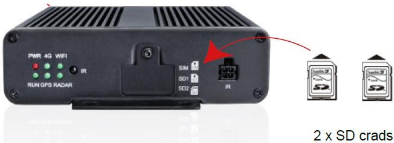
2 x SD crads