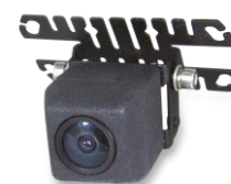
WTJ636 ミニキューブカメラ