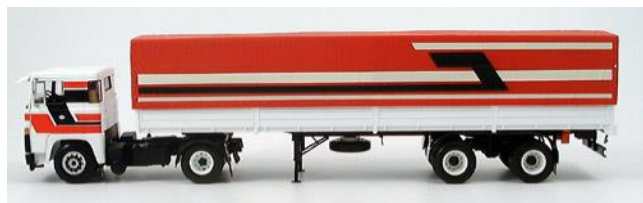
トラック トレーラー

※TXは通常バック線から電源を取ります。その場合バック時のみ映像を見れます。常時映像を見る場合は他から電源の確保が必要です。