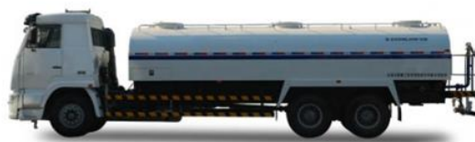
タンクローリー車