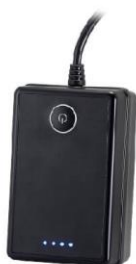
カメラ用防水バッテリー