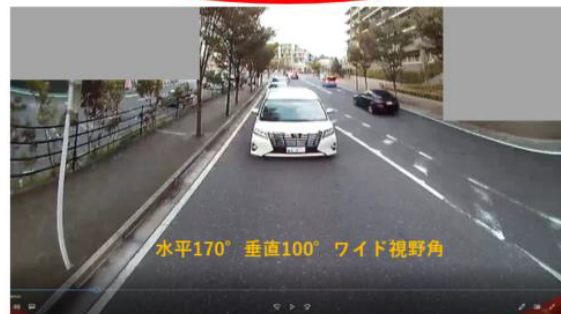
歪み補正機能標準で線も丸く歪まずとても見易いカメラです。